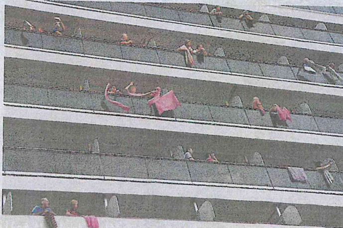
Passengers on board the 'Westerdam' cruise ship waving Cambodian krama scarves in Sihanoukville on Friday, where the liner docked on Thursday after being refused entry at other Asian ports due to fears of Covid-19. Last night, an American woman from the ship tested positive for the virus after arriving in Kuala Lumpur.

"We do not need it as China had imposed a lockdown. We do screenings on Chinese nationals as soon as they arrive, and it will be more stringent now. We are doing this based on the instructions of the World Health Organisation (WHO). We take our country's needs into consideration.