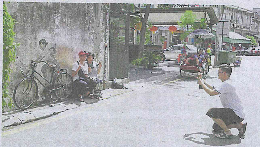
No rush: Tourists taking photos at the 'Children on Bicycle' mural on Armenian Street, George Town.

"We follow all the basic precautions and take good care of our