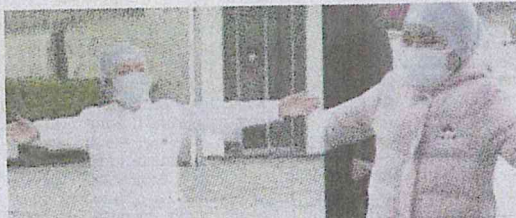
Tangisan anak dan ibu bertugas sebagai jururawat di sebuah hospital di Zhoukou, China yang 'memeluk angin' meruntun jiwa.

Jururawat itu antara ratusan ribu kakitangan kesihatan di ba-