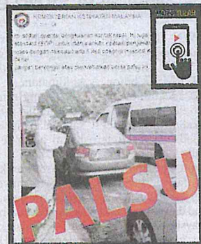
Kenyataan media KKM berhubung satu video yang tular di media sosial mengenai dakwaan palsu lima kes positif Covid-19 di sebuah hospital di Klang.

SHAH ALAM - Kementerian Kesihatan (KKM) menafikan terdapat lima kes positif Covid-19 di sebuah hospital di Klang berikutan satu video yang tular di media sosial semalam. KKM melalui laman Facebook rasminya memaklumkan, video berkenaan merupakan prosedur operasi standard (SOP), dalam menjalankan operasi mengesan kontak rapat. "Tular video dengan dakwaan ada lima kes positif di hospital itu adalah tidak benar. "Jangan berkongsi atau menyebarkan berita palsu ini," kata kenyataan itu. Kelmarin, tular video berdurasi lima saat di media sosial yang mendakwa terdapat lima kes positif Covid-19 di sebuah hospital yang ditulis sebagai 'Hospital Klang'. Dalam klip video itu, kelihatan seorang petugas perubatan memakai pakaian perlindungan bersama beberapa orang awam yang turut memakai topeng muka di hospital terbabit.