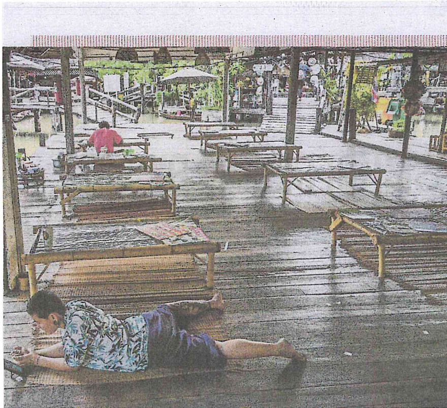
An empty food court at the Floating Market in Pattaya, Thailand. Elephant parks unvisited, curios at markets unsold and tuk-tuks sit idle. The Mekong is absorbing billions of dollars of losses from a collapse in Chinese tourism since the outbreak of the deadly Covid-19.

AKHBAR : NEW SUNDAY TIMES MUKA SURAT : 3 RUANGAN : NEWS/STORY OF THE DAY